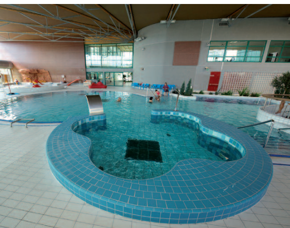
Espaces ludiques aquatiques et patinoire Glisséo à Cholet